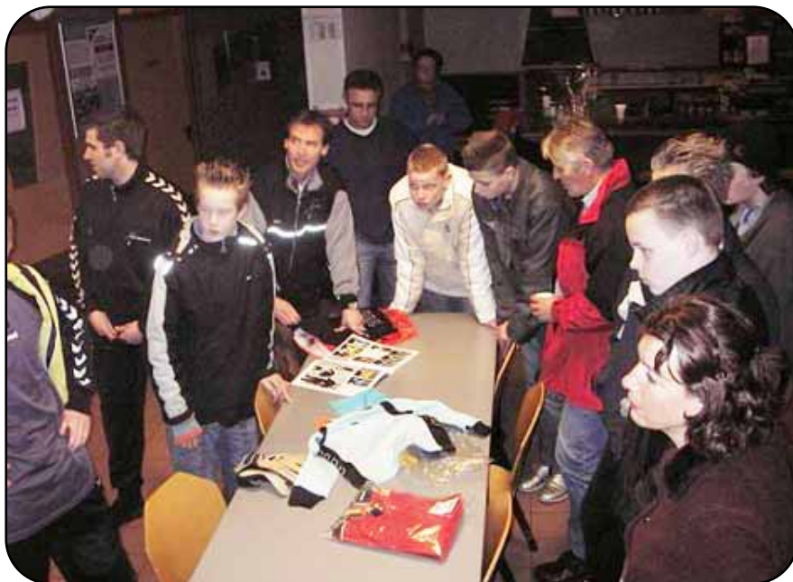
Afgelopen maand hebben een groot aantal keepers, waaronder ook kleine (1.40 meter) met grote capaciteiten, hun stem uitgebracht om een keuze te maken voor het nieuwe keepershirt.